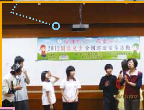
純潔運動協會 - 生命教育