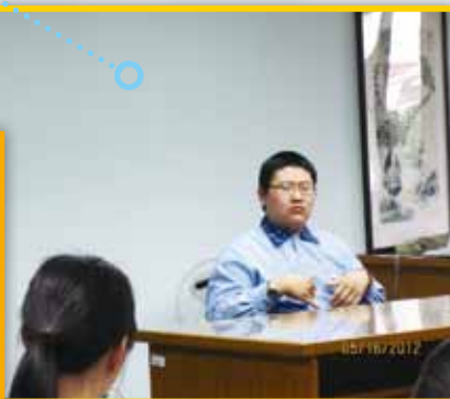
國中部手語說故事