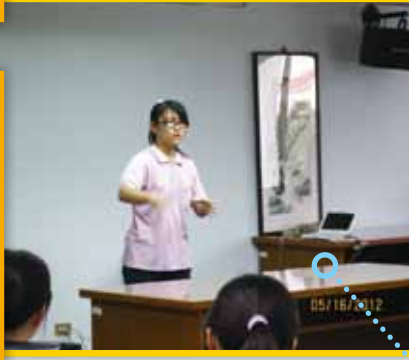
國中部手語說故事