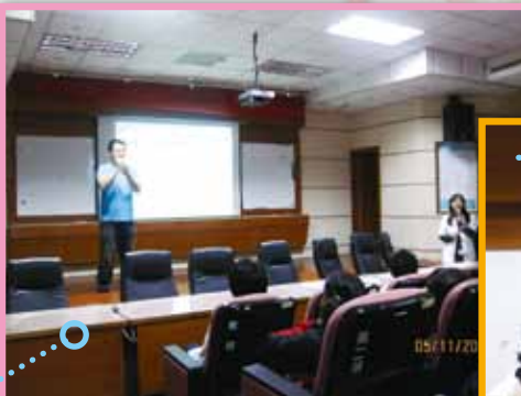
職能治療師晨間宣導