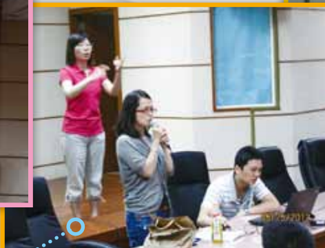
語言治療師晨間活動