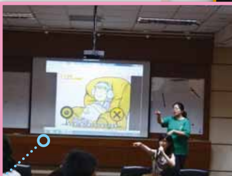
臨床心理師晨間活動