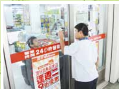
▲高三義班學生合力完成工作