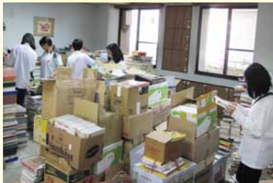
▲ 102年2月底截止募書，感謝各界善心人士捐贈滿滿的圖書

閱讀能力的建立與良好閱讀習慣的養成，一直以來都是教育重要的課題，對於長期失去聽覺、依賴視覺管道學習的學生而言，閱讀更顯重要。