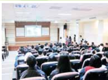
▲法律扶助基金會簡介及霸凌法律常識宣導