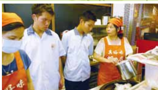
▲帶學生至校外實習面試