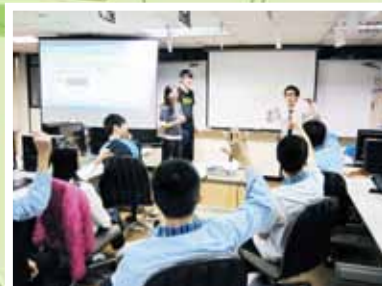
▲體驗營資處科，學生踴躍參與