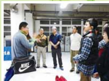
▲運動休閒班上課情形