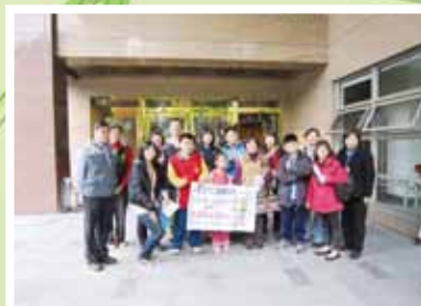
▲綜職科轉銜輔導機構參訪，於中道淨苑合照