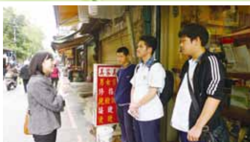
▲帶學生至校外實習面試