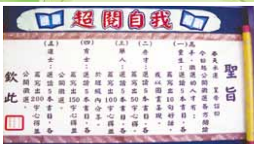
▲超越自我閱讀活動