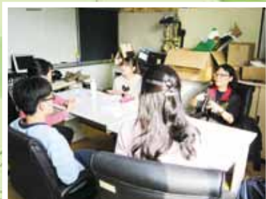
▲高三校學生職評情形