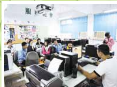
▲體驗營圖文傳播科