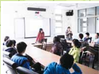
▲高三學生生涯檔案-履歷宣導