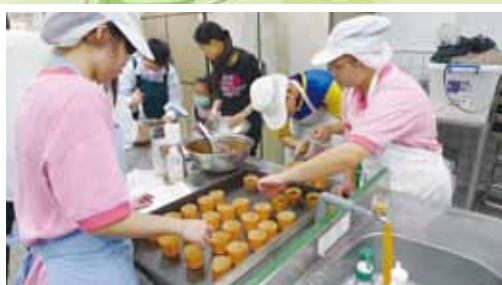
▲帶學生至北智參加烘焙大挑戰