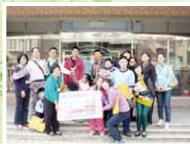
▲綜職科轉銜輔導機構參訪，美好基金會合照