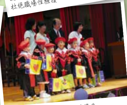
畢業典禮－鵬程萬里 啟聰傳愛