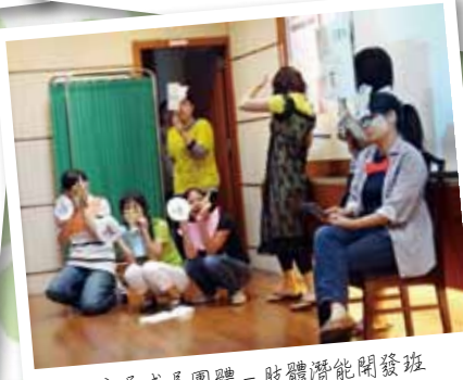
蕙心家長成長團體－肢體潛能開發班