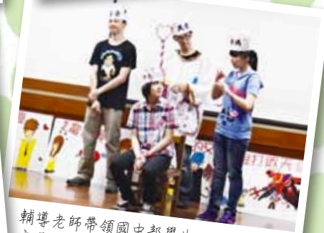
輔導老師帶領國中部學生 行性平戲劇 宣導活動