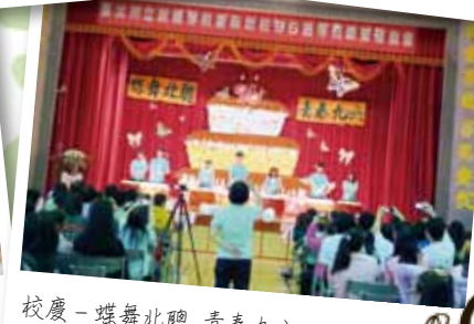
校慶－蝶舞北聰 青春九六