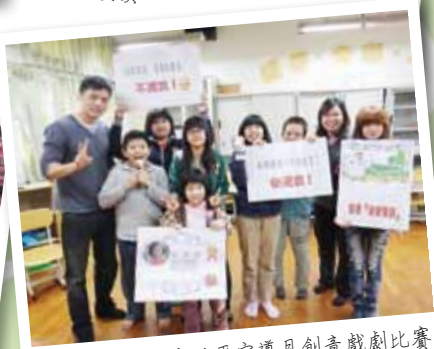
國小部參與北市性平宣導月創意戲劇比賽 榮獲「特別獎」