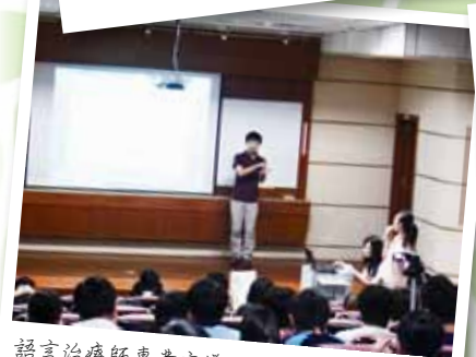
語言治療師專業宣導