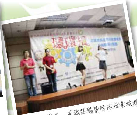
就業安全講座－求職防騙暨防治就業歧視 杜絕職場性騷擾