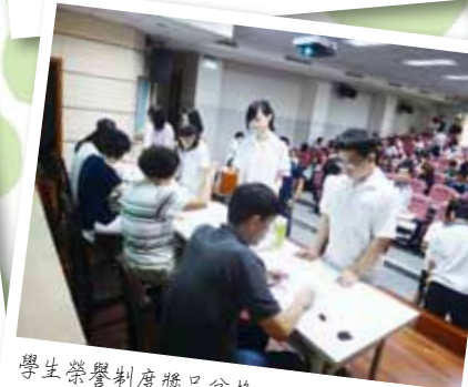
學生榮譽制度獎品兌換