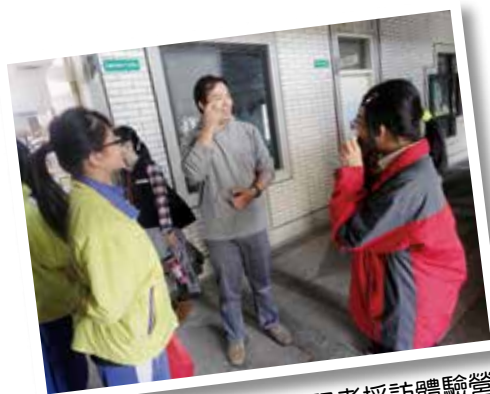
校園小记者採訪體驗營

黃同學現在讀慈文國中，她覺得啟聰學校跟她想的不一樣，她說今天參加體驗營感覺還不錯！。