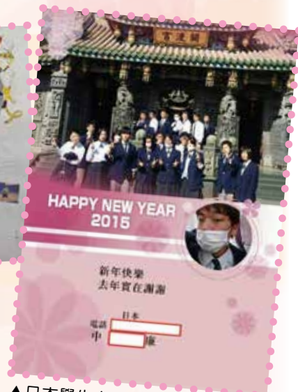
▲日本學生自製卡片以 LINE 祝賀本校老師新年快樂