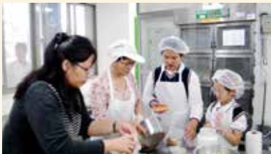
▲上海第四聾校學生入班體驗烘焙課

這一班的小主人們也第一次學習擔任「外交大使」之任務，藉由此次的交流活動，增加認識新朋友的經驗之外，也讓他們學習「待人」良好的態度與「接物」應有的進退。