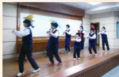
▲國一忠班手語歌表演

因為被感動，才短短的一個下午，原本少話的，談開了；原本羞怯的，放開了，原本陌生的，笑開了！最後的離別時間，有一位日本老師，想要把我們的學生帶走，而我們不少的學生很配合，跟我們說拜拜，作勢要跟日本人走。離情可以不用這麼不捨，也可以很搞笑！