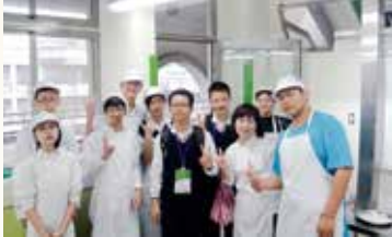
▲上海第四聾校學生入班體驗烹飪課