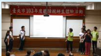
▲高二忠班孝班同學集體介紹美工傳圖科