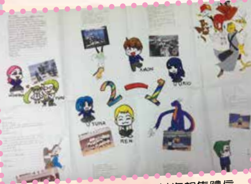
▲日本學生以海報集體信件寄給本校師生問候