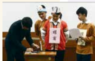
▲國二忠班魔術表演與日本來賓互動

這學期從十一月到年底的大型接待活動一連串下來，看到國中部學生們精緻的演出，我們學校國際交流的經驗也更昇華。真的要給國中部師生們一個大大的讚！