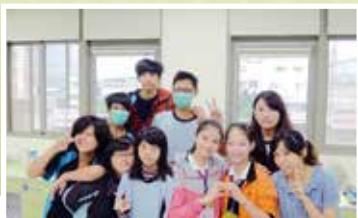
▲上海第四聾校學生與綜合家政科師生交流

中午的時候，我們去吃火鍋，一起一邊聚餐一邊聊天過得開心呀！吃完後我們去凱達格蘭博物館去參觀，導覽人員幫我們介紹，上海的學生們這麼專心，這次他們第一次學到歷史的文化部分。我看到他們對我們微笑的笑容，就知道這一天，我們和他們的心情都是非常豐盛愉悅，也在生命中留下難忘的回憶。