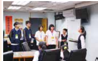
▲高二忠班學生接待上海第四聾校學生之相見歡