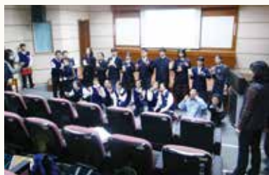
▲國中仁班高職義班交換禮物合照

103年12月29日，東京都廳美術專科學校帶領東京都立中央聾學校、東京都立立川聾學校、東京都立葛飾聾學校以及明晴學園等四所學校，還有十位擁有藝術專長之聽障日本學生來本校進行兩國藝術交流。