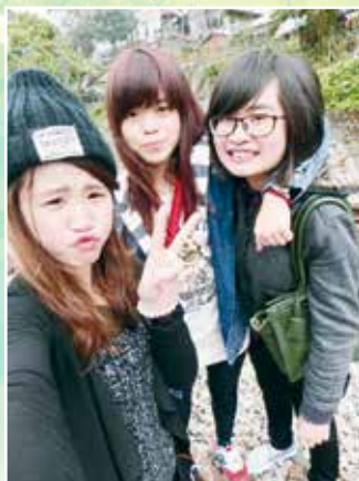
▲有朋友的相伴不會孤獨寂寞

鮮花感恩雨露，蒼鷹感恩長空，高山感恩大地，而我感恩一切！感謝曾經出現在我世界的貴人，感謝師長們的指點迷津，引導我走向康莊大道；感謝父母親含辛茹苦地拉拔我長大，並且教導我做人處事的道理，讓我還能像兒時依偎著他們，繼續探索與學習。蜜蜂勤於工，而好過冬，我堅信追夢過程的價值更甚一切。在這裡祝福正在努力的學弟妹們勇於追夢，夢想成真。