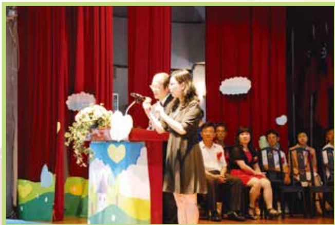
▲校長為畢業生勉勵時時心存感恩