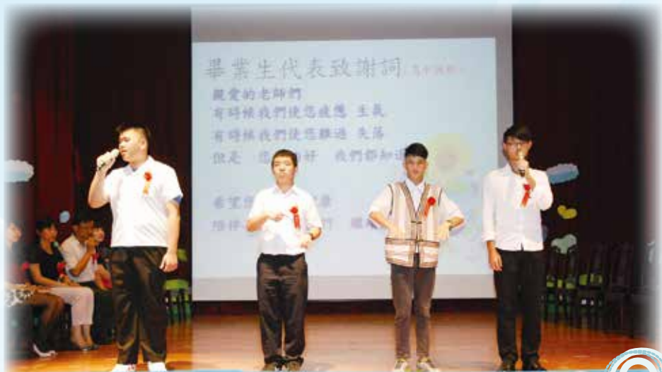
▲高中職部畢業生代表致詞

實現夢想的過程可能會遇到許多困難，因此我更要認真學習，克服困難，從現在開始，我必須做好應該做的事，如：做事態度要認真、要有禮貌、熱心助人……等，從小打好基礎，這樣跟實現夢想的距離就不遠了。