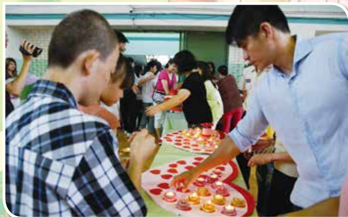
▲國小部畢業生薪火相傳