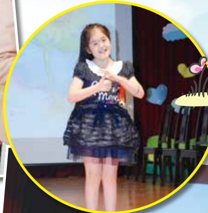
◀國小畢業生代表致詞