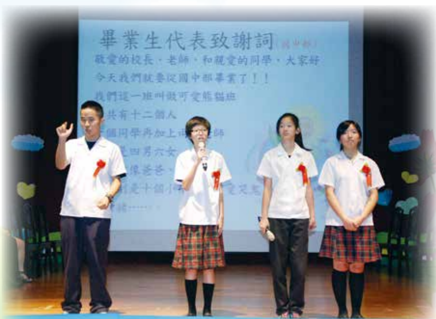
▲國中部畢業生代表致詞

這三年下來老師耐心教導我們口語和手語，每位同學過得充實又快樂。像我們有當主持人，有口語、有手語，同學也有介紹自己的創意藝術、表演……等。讓老師覺得很欣慰。但是時間過得好快，我們心裡真的捨不得離開國中部，在畢業典禮時，我們緊張又捨不得，想到要分離，就會感到難過……。還好都在同一所學校，每天還是可以見面。往後我們都會在自己所選的科別裡努力。