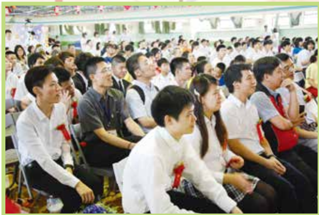
▲畢業生在臺下專心聆聽師長訓勉