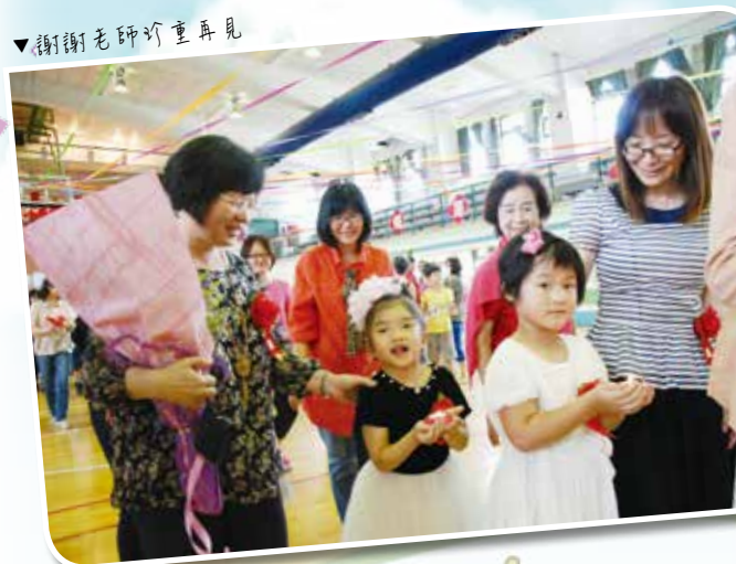
▼謝謝老師珍重再見