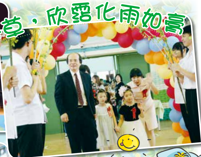
▲校長與師長引領學前部畢業生進場