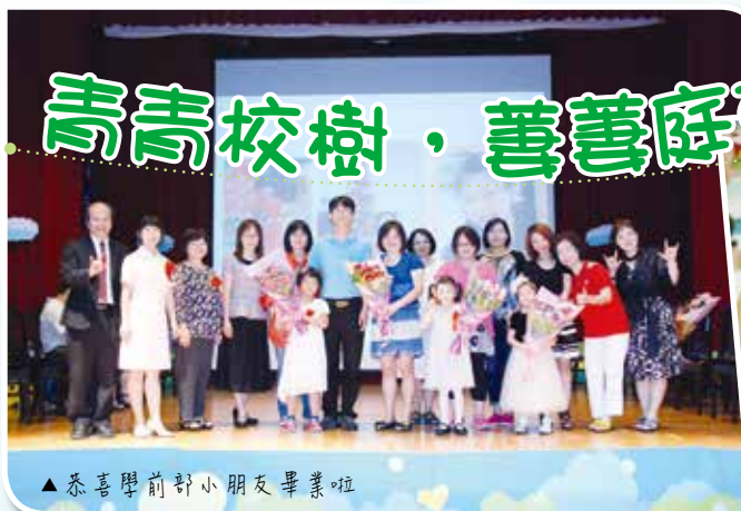
▲恭喜學前部小朋友畢業啦