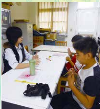
▲指導學生參加手語演講比賽