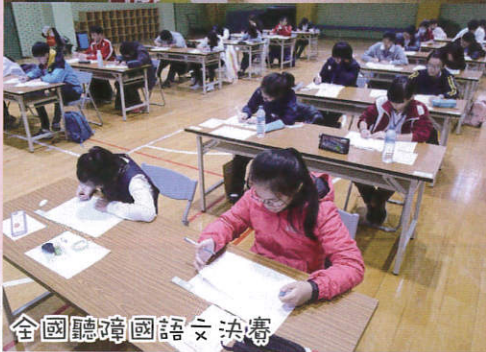
全國聽障國語文決賽