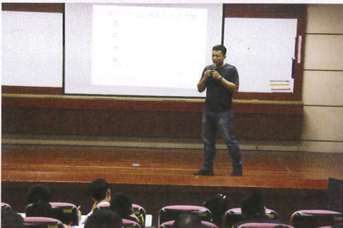
▼交通安全常識測驗