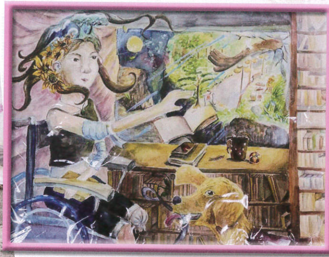
評審特別獎 高二忠班 朱曉燕