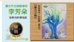
特教生藝術聯展 得獎作品