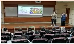
辦理多元文化講座