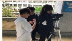
學生於校園中進行 影片拍攝