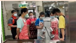
學生進行職業試探