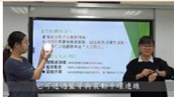
全國高中職創意發明 構思競賽說明作品