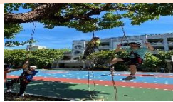
暑期探索教育~垂降