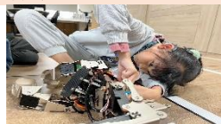
國小學生為資通訊大賽準備中