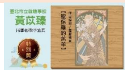
特教學生藝術競賽特別獎