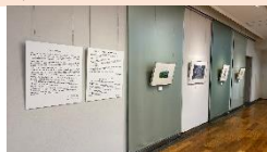
111 年度東京-台北聾生畫展