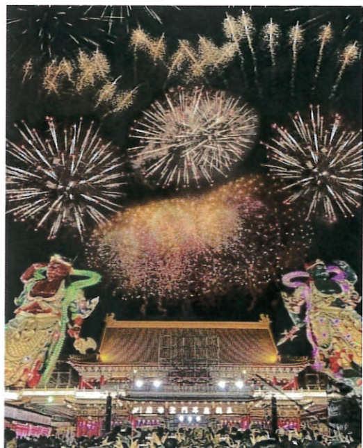
這是在聖母廟門口拍的煙火

這趟旅程我覺得非常好玩，也接觸了很多臺南文化的體驗，讓我留下深刻印象，且美好的回憶。