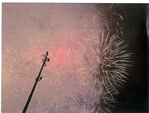
看完第一場後去停車場坐著欣賞第二場的煙火